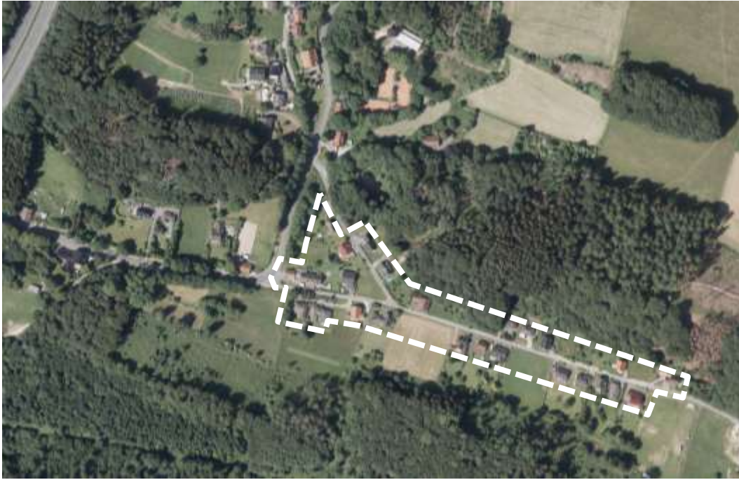
Abb. 1: Darstellung des Geltungsbereiches im Luftbild