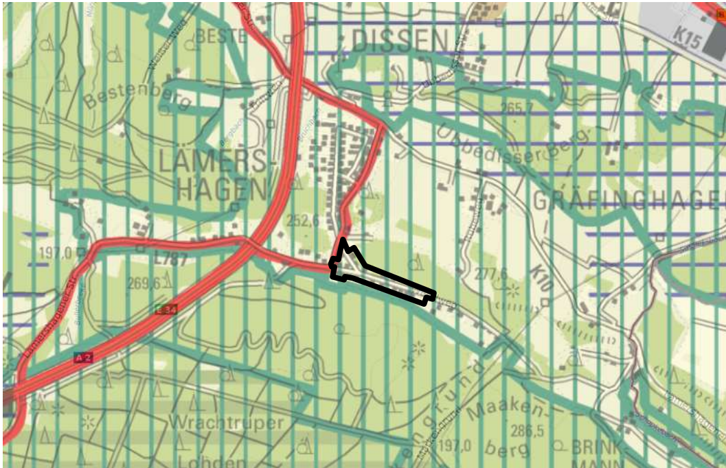
Abb. 2: Darstellung des Geltungsbereiches auf dem Regionalplan

Trotz der von den Planungszielen abweichenden Darstellung des Regionalplans sind raumplanerische Belange nicht berührt, da die Größe des Geltungsbereichs der Außenbereichssatzung unterhalb der Grenze einer regionalplanerisch raumbedeutsamen Planung von 10 ha liegt und die Planungsziele des Regionalplans darüber hinaus durch die von der Außenbereichssatzung ermöglichten baulichen Nutzung nicht maßgeblich beeinträchtigt werden.