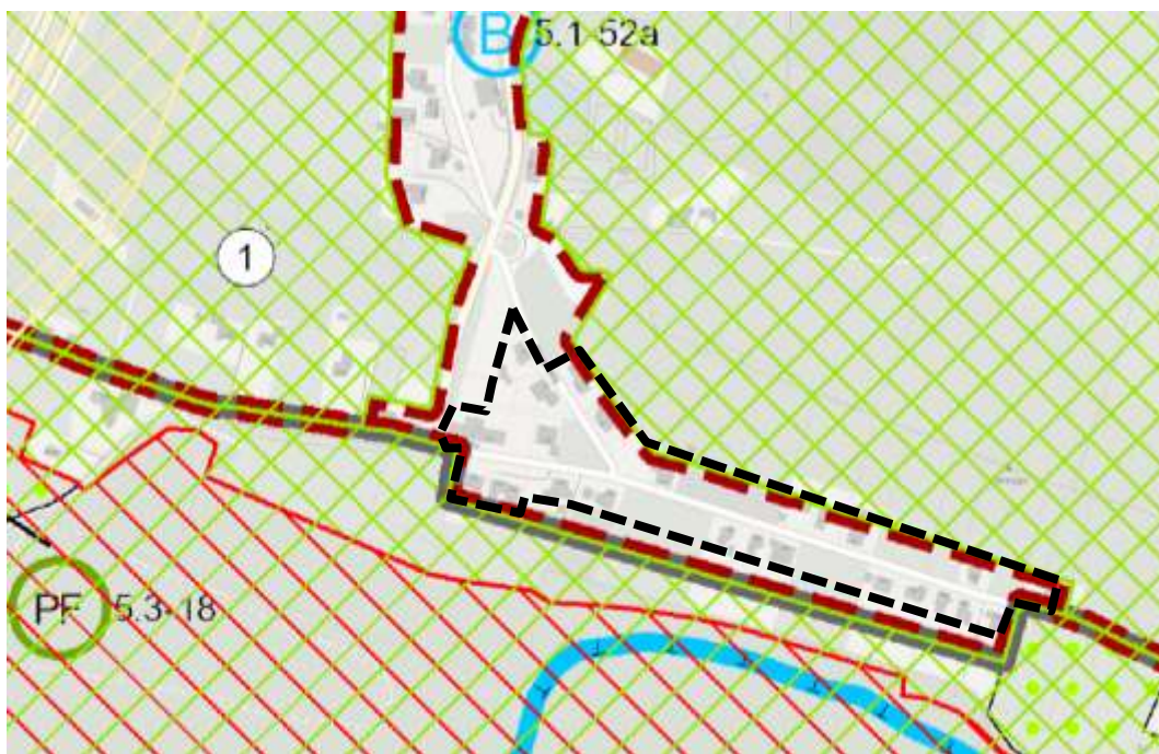
Abb. 4: Darstellung des Geltungsbereiches auf dem Landschaftsplan

Das Gebiet wird nicht durch den Landschaftsplan erfasst. Der Geltungsbereich wurde so gewählt, dass er nur bis zu den Rückseiten der am weitesten vom Wandweg abgerückten Bestandsgebäuden reicht und somit vor der Grenze des Landschaftsplans sowie des angrenzenden Landschaftsschutzgebietes endet bzw. teilweise ungefähr mit diesen übereinstimmt.