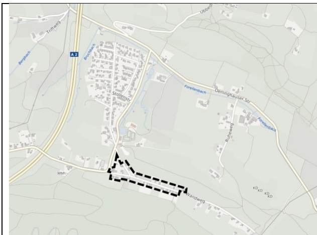
Lage im Stadtgebiet, ohne Maßstab

Entwurfs- und Veröffentlichungsbeschluss